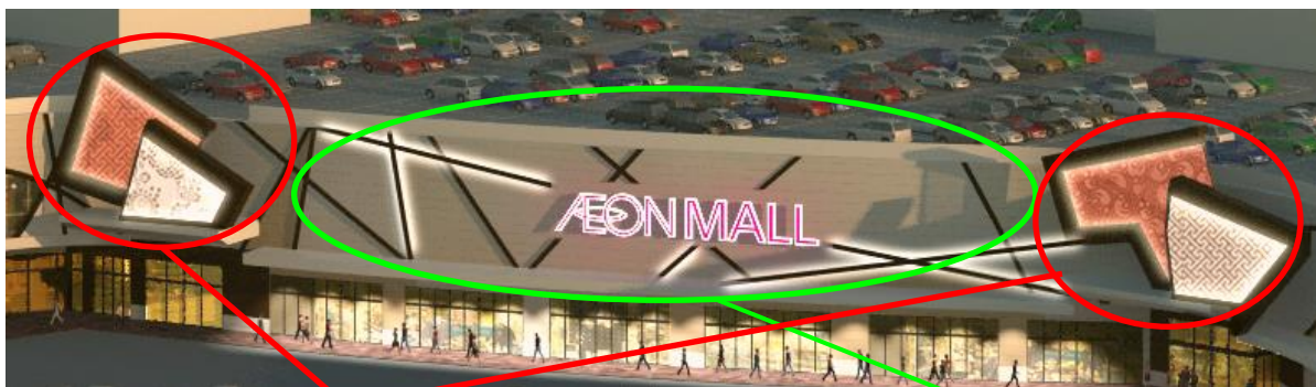
エントランスデザイン