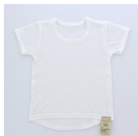
半袖クルーネックTシャツ