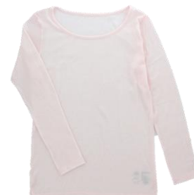
長袖クルーネックTシャツ