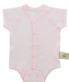
前開きボディースーツ