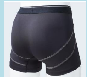
ボクサーブリーフ