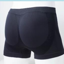
成型ボクサーブリーフ