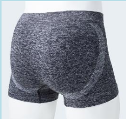
成型ボクサーブリーフ

▼低着圧である青系色が全体に分布しており、お尻全体に均一に着圧がかかっています。