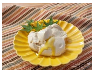
クリーミーな濃厚とうふ