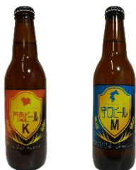
門真ビール K 守ロビール M

地元門真市の「福万佐豆腐店」の「クリーミーな濃厚とうふ」や「手作り京がんも」、「マツモト」の漬物各種、「御菓子屋 絹笠」の「絹かずき」などを取り扱います。さらに、「門真ビールK」「守ロビールM」などの大阪クラフトビール各種をはじめ、「和泉食品」の「パロマお好みソース」をはじめ「谷町ポン酢」、「キンリューフーズ」の「金龍 焼き肉のたれ」などを取り揃えます。