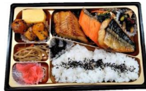
蕪塩仕立ての焼き魚弁当 (鮭・鯖・ほっけ)

鮮魚コーナーでは、鮮魚を使ったボリュームのあるネタが特長の魚屋の握り鮓、お造り、焼き魚、弁当もご用意しています。対面鮮魚販売においては、お客さまのご要望に合わせた調理サービスや、おいしい食べ方を提案します。さらに、近畿の漁港の鮮魚や全国の旬の鮮魚を取り揃えてお客さまのニーズにお応えします。