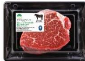
タスマニアビーフ

肉質等級4等級以上・丁寧加工にこだわった「匠和牛」、赤身のうまみと柔らかさ・安全安心にこだわった「タスマニアビーフ」を1頭仕入により豊富な部位を品揃えします。また、焼肉用には、色々な部位をお求めいただけるよう、小容量を取り揃えます。