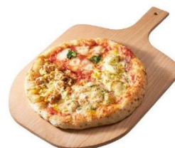
クアトロ・グラッツィエ