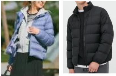
ウオッシュブルダウン スタンドジャケット ウオッシュブルリサイクル ダウンブルゾン

リサイクルダウンを100%使用したサステイナブルなダウンジャケットです。通常販売価格から約30%引の値下げ価格で提供します。