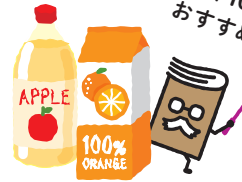
お好みのジュース