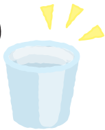
紙コップ (小さめのもの)