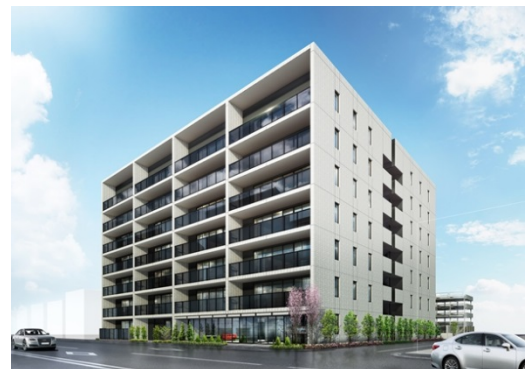
アデニウム墨田本所外観イメージ