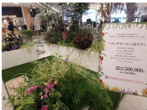
ベランダガーデンプラン50