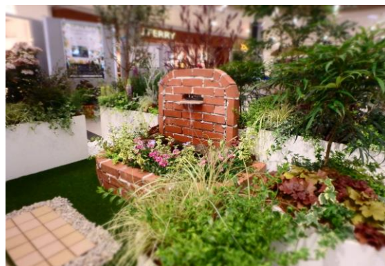
ベランダガーデンプラン80