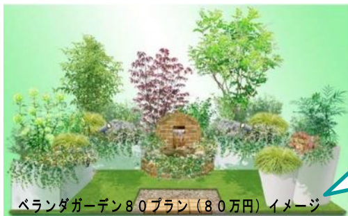
ベランダガーデン80プラン（80万円）イメージ ※お客さまのお庭に応じて価格、仕様は異なります。

ベランダや戸建てでも、洋ガーデンでも和風庭園でも、ご予算に応じて選べるプランをご用意しています。