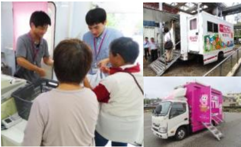
館山市・南房総市での移動販売