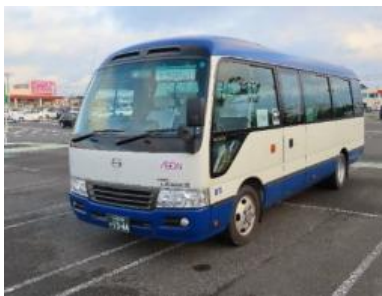
鴨川市・館山市・木更津市内 臨時シャトルバス運行