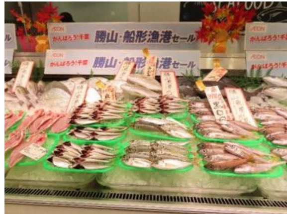
がんばろう！千葉「勝山・船形漁港セール」（千葉県の店舗で実施）