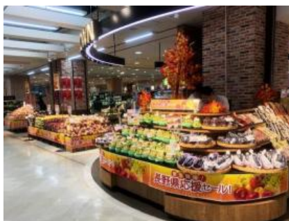
長野県応援セール（イオン新浦安店）