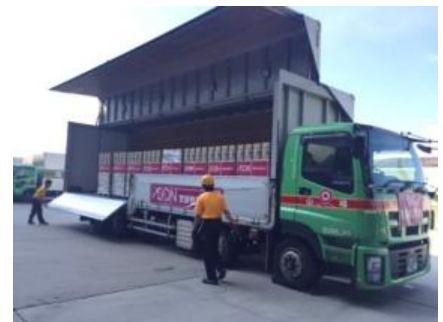
関東地区配送センターでの 救援物資手配