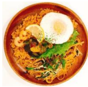
「アジア弁当セット」 ナシゴレン&シンガポールビーフン