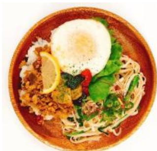
「アジア弁当セット」 スパイシーガパオライス&パッタイ