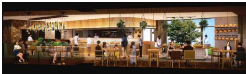
森のサーカス ～cafe & family restaurant～

ママ友やファミリーでくつろげるカフェ&レストラン「森のサーカス ～cafe & family restaurant～」やカジュアルな「肉中華バル WOK」、スペイン料理の「ファミリア ピンチョス テララ」を展開します。