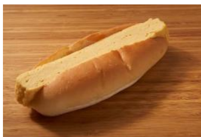
だし巻ドッグ（海老江ドッグ）