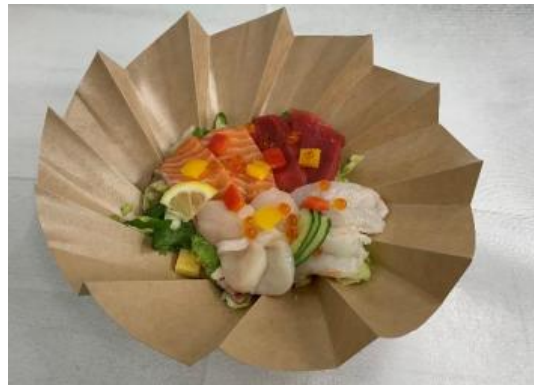
「ドレッシングで食べるサラダ鰯」