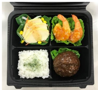
「選べるお弁当」 3種類の総菜と白ごはん