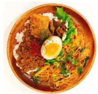
「アジア弁当セット」 ルーローファン&チャプチェ