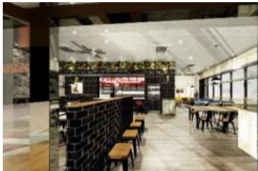
THE MANHATTAN GARDEN

「類農園直売所」では、生産者さんから直送される地産地消の新鮮オーガニック野菜やこだわり食材をお楽しみいただけます。