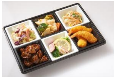
「バルセット」 総菜6品