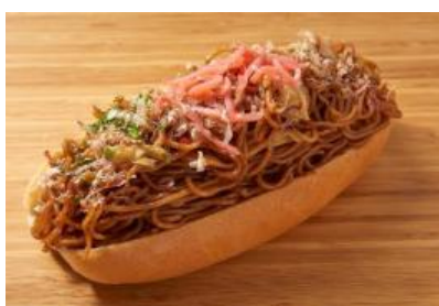
焼きそばたっぷりドッグ