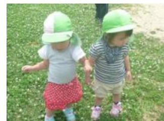
海東ひばりベビーセンター

地域の共働きの家庭をしっかりとサポートするため、小規模保育の「海東ひばりベビーセンター」や、ダンスや英会話、プログラミングなど毎日通いたくなるスクールがある、キッズ教育「森のキッズ e クラブ」と幼児教育「講談社こども教室」が出店します。