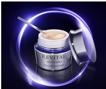
リバイタル エクストラリッチクリーム(医薬部外品)

※4 インテージ SLI スキンケア市場 19年8-20年7月 クリーム年齢別購入率