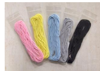
マスク用カラーゴム