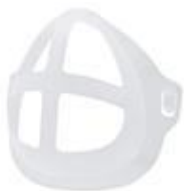
マスクスペーサー