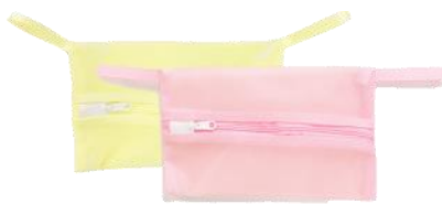
マスク用洗濯ネット