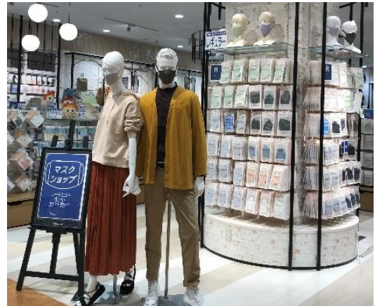
天然オイル配合 PASTEL MASK