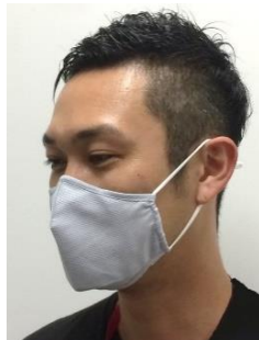
トップバリュ Shirt Mask