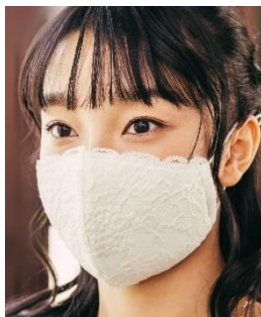
トップバリュ プラの工場で作った レースマスク