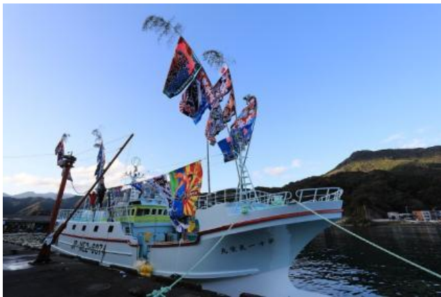
認証を取得した漁船

イオンリテールは今後も、限りある水産資源を守り、伝統的な魚食文化を未来の子どもたちに残していくため、生産者の方々と協力しながら「持続可能な調達」を推進・継続してまいります。