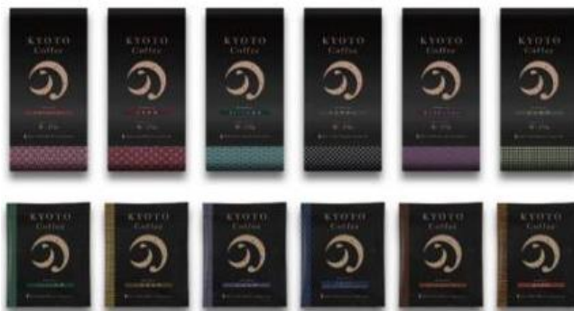
小川珈琲をはじめ、12社の焙煎コーヒーが勢ぞろい！