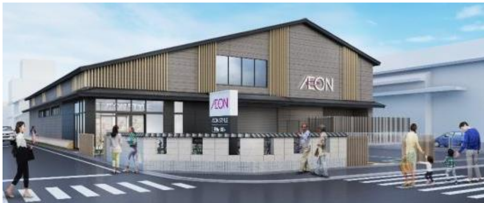
町屋風で落ち着いた佇まいの外観

こうしたなか当店は、「食と健康の京町コンビネーションストア」をコンセプトに、生鮮品やパン、時短・簡便・健康といった「食」を中心に、毎日の生活に欠かせない日用品を組み合わせた便利なお店をめざします。