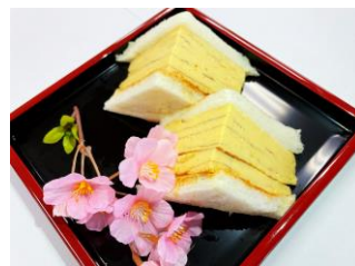
京風だし巻きをふんだんに使用したサンドイッチ