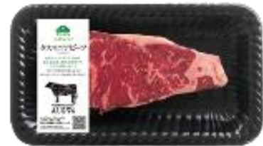
タスマニアビーフ

イオン直営牧場から調達している「トップバリュ グリーンアイナチュラル タスマニアビーフ」や、肉質等級4等級以上の“厳選品質”の肉を、高度な技と徹底した品質管理で提供する「トップバリュ セレクト 匠和牛」を品揃えします。