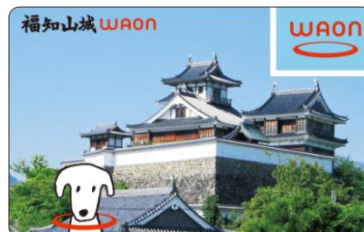
【福知山城WAON】 福知山城など観光施設の支援や地域の活性化に役立てられます。