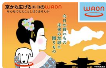
【京から広げるエコのWAON】 京都府の環境保全対策に役立てられます。