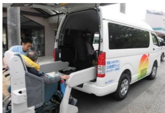
寄付金の支援活動の一例（福祉車両の贈呈）