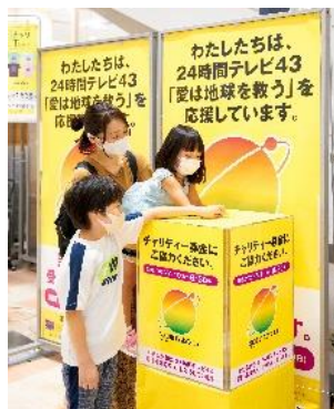
イオン店頭募金の様子