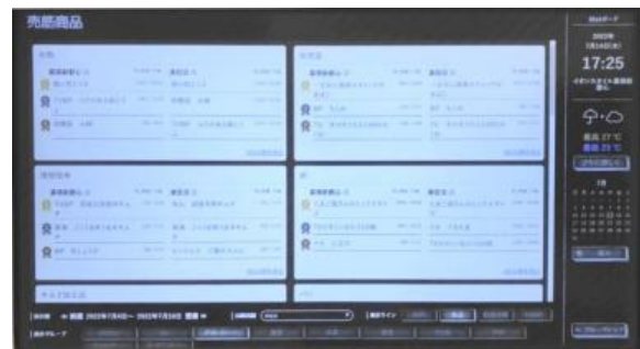
店舗横比較で部門別の売筋商品を表示