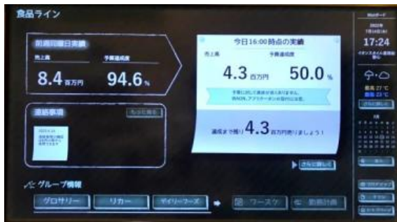
売上進捗や連絡事項を表示