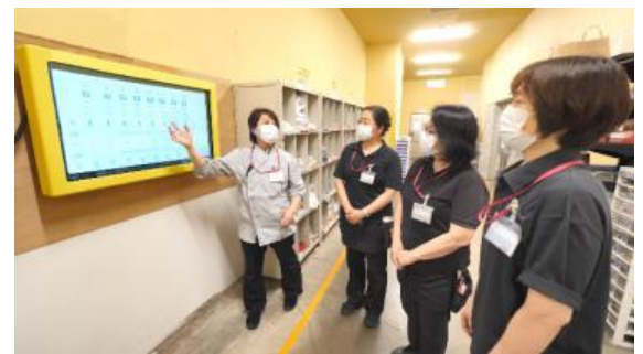
チーム単位でのミーティングに活用