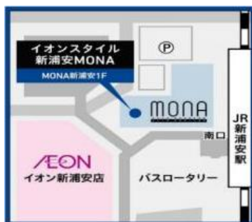
イオンスタイル新浦安MONAフロアマップ