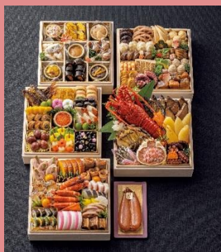
貴船「右源太」 右源太監修 和五段重「氣生根」

糖質・塩分配慮やスイーツなど豊富なラインナップで、全体品目数は前年比1割増の、計160品目を取り揃えます。