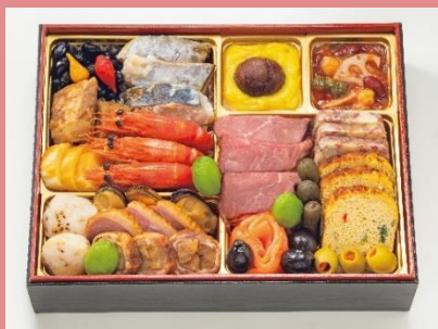
ホテル椿山荘東京 和洋おせち一段重