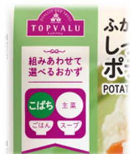
【パッケージアイコン】

商品名：トップバリュ チルド惣菜シリーズ 発売日：2022年9月28日(水)より順次発売 品目：20品目(2022年9月28日時点) 価格帯：本体98円(税込105.84円 ※2 ) ～本体398円(税込429.84円 ※2 ) 販売店舗：「イオン」「イオンスタイル」など、全国約3,000店舗 ※1