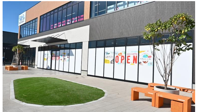
静岡県の天竜川流域で適切に管理された木材からつくられたベンチ