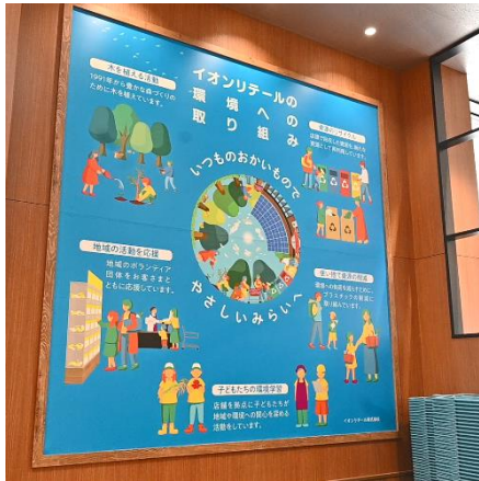
「いつものおかいもので やさしいみらいへ」メッセージ

一例として、「いつものおかいもので やさしいみらいへ」というイオンリテールのメッセージを込めた環境への取り組み紹介や、浜松市を流れる天竜川流域の間伐材からつくったベンチを集いのスペースに設置するなど、より親近感をもって、環境への取り組みに触れられる機会をつくります。また、当社初となる「ご意見承りボードのデジタル化」や「電子レシート機能」をイオンスタイル浜松西伊場で実装し、使いやすさや利用率などの検証を進めます。