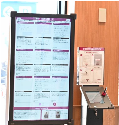
「ご意見承りボード」のデジタル化