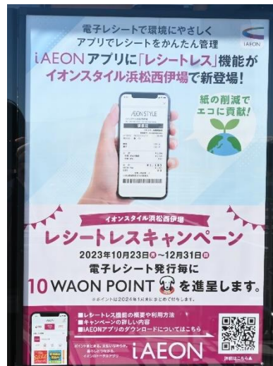
「電子レシート」発行機能の案内