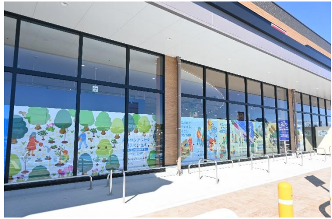
店舗の窓に、親近感の湧くデザインで取り組み紹介