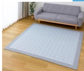
アイスコールド 洗えるキルトラグ (185×185cm) 価格：本体5,980円 (税込6,578円)