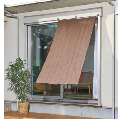
風が通る日よけシェード

昨年は観測史上最も暑い夏になり、今年はさらに猛暑日が増えると予想されるなど、近年全国的に気温が高くなっています。暑さから身を守る必要性が高まる一方、電気代の値上げや、猛暑による電力使用量の上昇から、節電対応商品へのニーズも年々高まっています。