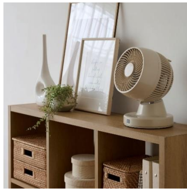
DCサーキュレーター