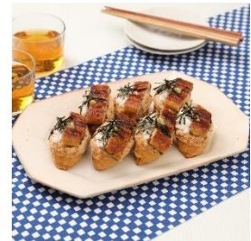
薬味でさっぱり♪ うなとろいなり寿司