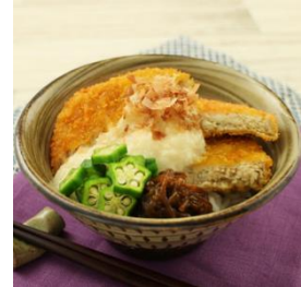
ガンゾウビラメの メンチカツのオクラとろろ丼