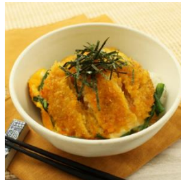
ガンゾウビラメの メンチカツのニラ玉丼