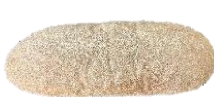
揚げパン (シナモン)