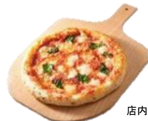
店内焼き上げピッツァ