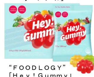
“FOODLOGY” 「Hey! Gummy」

2階医薬品売場では、健康をサポートする商品や美容食品など豊富に品揃えします。美容食品では、国内に限らず韓国サプリの取り扱いもします。一例として、生活習慣が気になる方やダイエットのサポートにおすすめの美容ゼリー「コレオロジーカットゼリー」やビタミンCと食物繊維を美味しく摂取できるグミ「Hey! Gummy」を取り扱います。