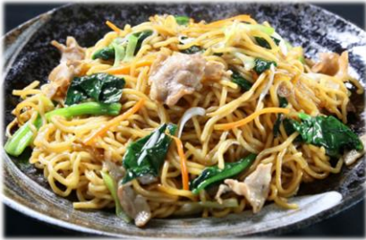
“見澤食品”「ところざわ醤油焼きそば」

隣接する埼玉県所沢市でオール所沢の原料を使った大正15年創業の老舗“見澤食品”の「ところざわ醤油焼きそば」、同じ所沢市で地元で親しまれる手作り豆腐の店“尾張屋”の「豆腐」「油揚げ」を品揃えします。また、狭山市で50年以上営業し地元の小中学校に学校給食として麺の提供も行う地域に根づいた製麺会社“大進食品”の各種麺や、重厚な香味とコクと旨みをもつ地元の銘産「狭山茶」を使ったスイーツ「狭山茶プリン」など、長年地元で親しまれてきた味を品揃えします。