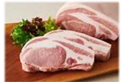
「ゴールデンポーク」

1946年創業の「豚の生産」-「加工品製造」-「販売」 SAIBOKU までを一貫体制で行う日高市に牧場をもつサイボクの商品を展開します。自社牧場で育てた、血統書付きのオリジナル銘柄豚「ゴールデンポーク」を品揃えします。ジューシーでキメ細かく、噛むほどにあふれる脂の甘みが特徴です。日高市内の直営工場にて製造されている人気のハム・ソーセイジも取り揃えます。