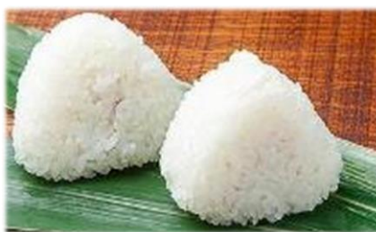
小さめサイズのおにぎり