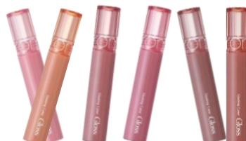
Rom&nd(ロムアンド) グロスやティントなど リップメイク商品