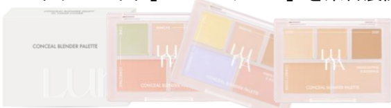
LUNA(ルナ) ルナ コンシルブレンダーパレット

韓国コスメを幅広く取り扱うほか、Z世代に人気の「キャンメイク」・「セザンヌ」を集合展開します。