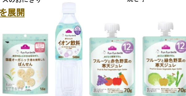
トップバリュ fun fun Smileのおやつ

独自の品質基準で安全性とおいしさにこだわり、栄養士・保育士のご意見を取り入れ企画・開発したトップバリュ「fun fun Smile」のベビーフードを取り揃えます。また、ベビーインナーやベビーオーラル用品など必需品を品揃えし、子育てに忙しい毎日をサポートします。