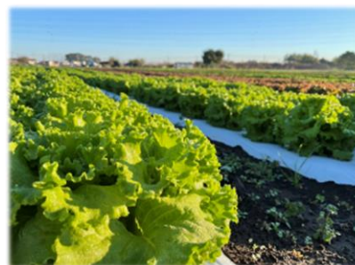
イオンアグリ日高農場

当店は、オーガニック農産物を育てているイオン直営のイオンアグリ日高農場から“今朝採れ”※1のオーガニック野菜を産地直送で提供します。グリーンレタスやリーフレタス※1をはじめとした鮮度抜群のオーガニックのサラダ野菜を提供し、サステナブルな消費のニーズにお応えします。ほかにも「イオン農場まるまる赤トマト」など赤くなってから収穫した鮮度自慢のトマトを含む30品目以上のトマトを展開します。