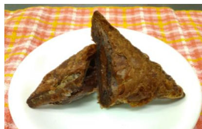
店内でサクリと揚げたチョコパイ

お子さまと一緒にランチやおやつの場所として気軽にご利用いただけるイートインスペースを提供します。焼きたて・つくりにたての商品を店内で座って食べたり、休憩したり、ランチやティータイムに、ゆったりくつろげる30席ほどのスペースを用意します。フレッシュデザートやサクリと揚げた当店自慢のチョコパイを味わえるカフェスペースとしても利用いただけます。