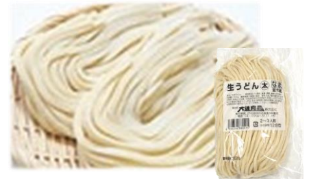
“大進食品”「生うどん」