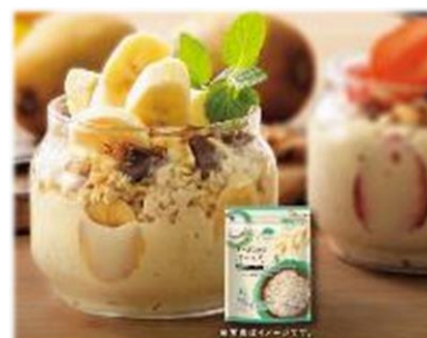
“トップバリュグリーンアイオーガニック” 「オートミール」

たんぱく質や食物繊維、鉄分もたっぷり含まれ、お米の代替として好評の“トップバリュ グリーンアイオーガニック”「オートミール」は乳児用規格適用商品であり、離乳食としてもおすすめの商品です。一日で大人に必要なカルシウム摂取量が補える商品など、不足しがちな栄養素補給を提案します。