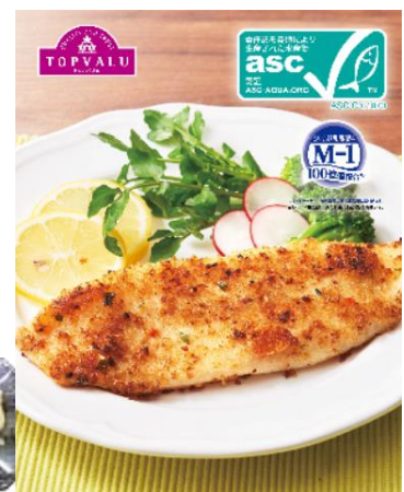
トップバリュ「骨取り白身魚の香味野菜パン粉焼」

お子さまに楽しく選んでいただける幅広いバリエーションのおやつも展開します。上記の小さめサイズのおにぎりに加えて、おやつパンやきな粉・シナモン風味の揚げパンなどを取り揃えます。焼き芋は一年通じて取り扱い、夏は冷やし焼き芋として提供します。