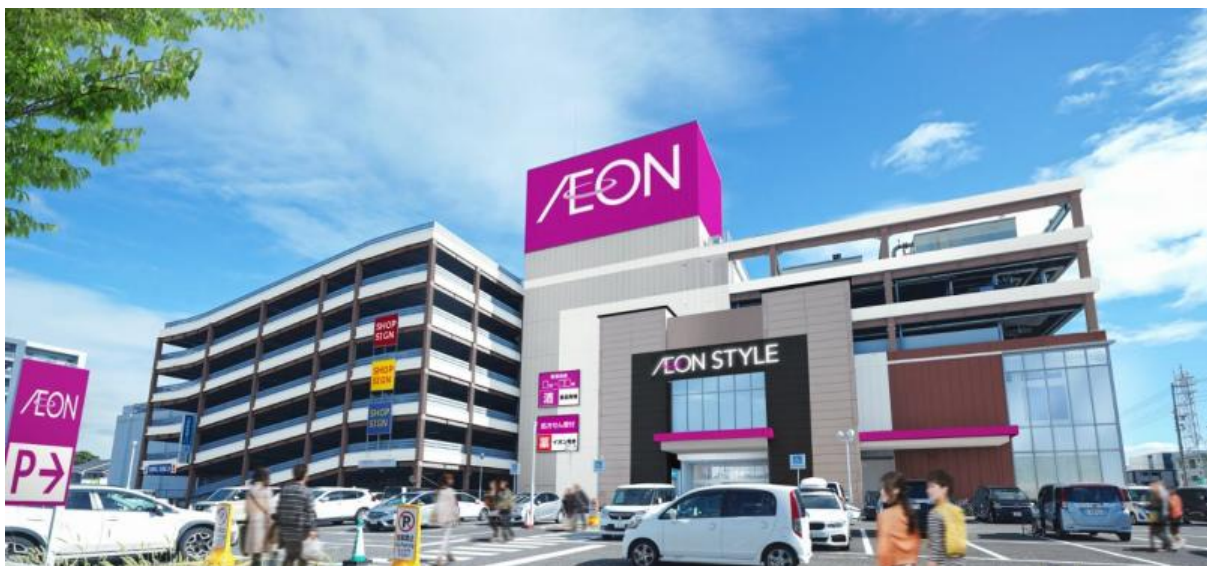
《店舗外観》 西側 展望イメージ（2025年3月26日時点）