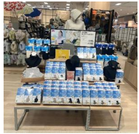
ピースフィット クール UVケア雑貨の集合展開