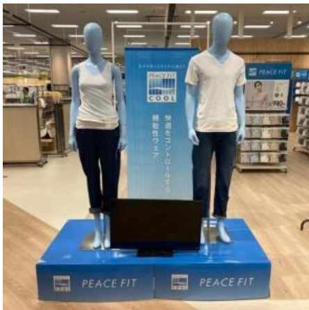
ピースフィット クールCMと連動