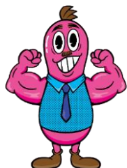
「オクトパー」 モチーフ：ヴルスト 食いしん坊な ドイツソーセージ