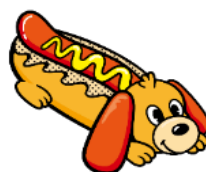
「ポチ」 モチーフ：ホットドッグ オクトパーのことが 大好きな犬