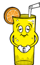
「オクトーバ」 モチーフ：カンパイグラス 人を喜ばせるのが好きな おばあさん