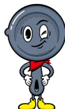
「オクトブラザー」 モチーフ：スキレット 皆の兄貴分の陽気で アツいスキレット