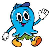
「オクトパー」 モチーフ：タコウィンナー みんなで盛り上がるのが 大好きなタコさん ウィンナーの少年