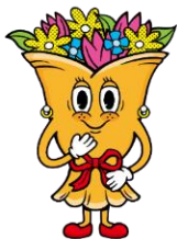
「オクトマダム」 モチーフ：花束 おしゃべりでおしゃれな 花束のマダム