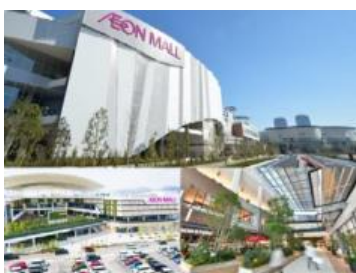
お買物だけではなく、お食事や店舗によっては映画も! 楽しくあたたかいイオンのお店へCome On!

来てあたたか、過ごして楽しい“WARM”な空間として、「イオン」「イオンスタイル」「イオンモール」の店舗で過ごすライフスタイルを提案します。お買物だけではなく、イベントや食事など、一日中館内で楽しくあたたかく過ごせる環境を用意しています。さらに、「イオン」「イオンスタイル」の店舗では、クリスマスや初売りなどで催事企画を実施します。