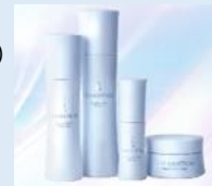
ブライトニング シリーズ各種