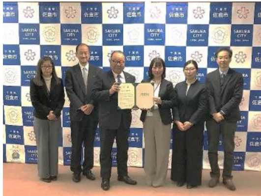
佐倉市との贈呈式の様子

イオンリテールは、2025年9月5日（金）から9月30日（火）の期間実施した「源気フェスティバル」の寄付金総額6,758,880円を各地域の福祉行政機関へ贈呈しました。これらの寄付金は地域のフレイル予防の取り組みに活用されます。