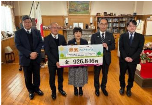
埼玉県との贈呈式の様子

寄 付 先：名古屋市福祉課 寄付金額：1,630,821円 贈 呈 式：2026年2月9日（月）