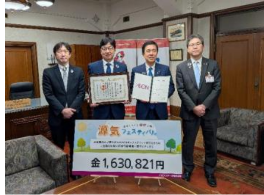
名古屋市との贈呈式の様子

寄 付 先：佐倉市福祉部 高齢者福祉課 寄付金額：2,086,247円 贈 呈 式：2026年2月4日（水）