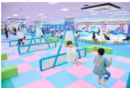
のびっこジャンボ（イオン和泉府中）