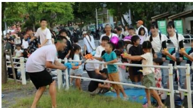
ツルマイ・チクサ ミズまつり

全国の各ショッピングセンター（以下、SC）では、ご家族で夏の思い出作りができる「こども縁日」を館内で計画しているほか、イオンタウン千種では名古屋工業大学等と連携した地域一体型イベント「ツルマイ・チクサ ミズまつり」を実施し、都市部での涼しい回遊空間を創出しています。また、各SCで自治体指定の「クーリングシェルター」として開放する取り組みを強化しており、2025年度で全国26のSCが指定を受けています。館内では「熱中症対策アンバサダー®」の講座を修了した従業員がお客さまの安全を守る具体的な対策を呼びかけるなど、安全で快適な環境を提供してまいります。