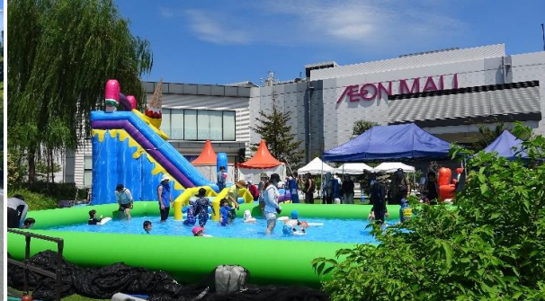
AGEO Water Park（上尾）