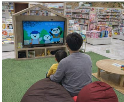
みらいやの森／（未来屋書店名取店キッズスペース）

未来屋書店では、地域の子どもたちが本を通じて世界をひろげ、豊かな心を育むお手伝いをするための児童書コーナー「みらいやの森 ※6 」を順次導入しています。親子でくつろげるスペースでは、読書や読み聞かせの動画を楽しむことができます。