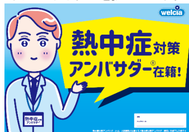
イオンのクールスポット ウエルシア店舗内のクーリングシェルター