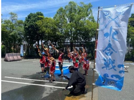
水合戦（浜松志都呂）