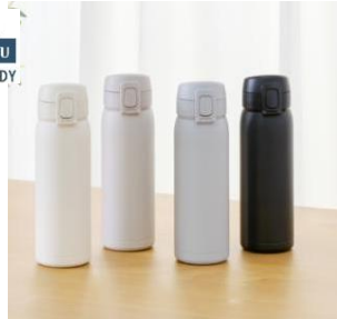
<ワンタッチマグボトル>