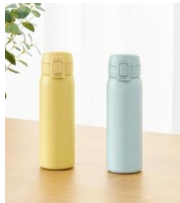
<パッキン一体型スクリューマグボトル>