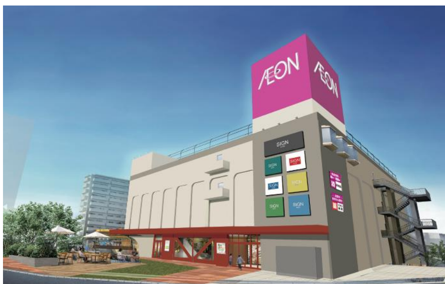
イオンスタイル鴨居 外観イメージ

イオンリテールは、5月28日（木）に「イオンスタイル鴨居」（横浜市緑区）を、6月4日（木）に「イオン海老名駅前店」（神奈川県海老名市）をオープンします。